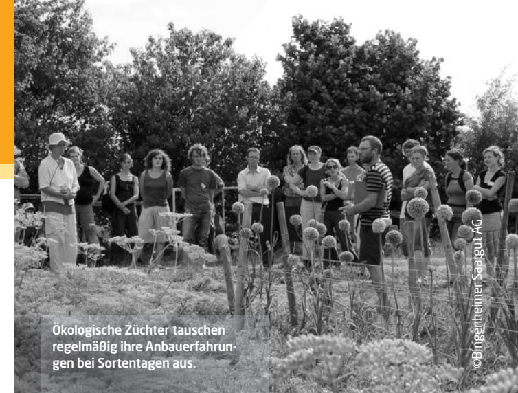
Ökologische Züchter tauschen regelmäßig ihre Anbauerfahrungen bei Sortentagen aus.